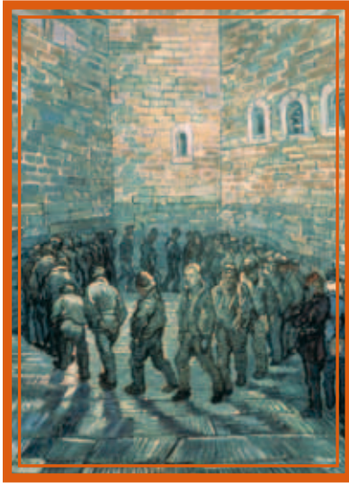
A De eerste schilderijen van Van Gogh waren nog somber en donker.